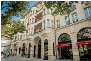
Business-Center im Haus Cumberland